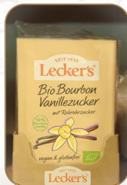
Im regal-fertigen Karton geliefert (Shelf Ready)